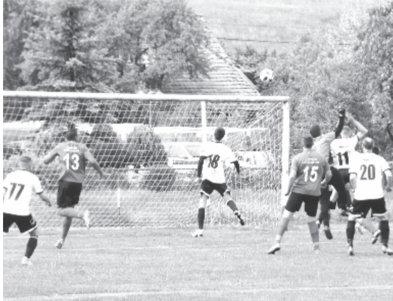
A vendégek nem tudtak mit kezdeni a hazai fölényvel.