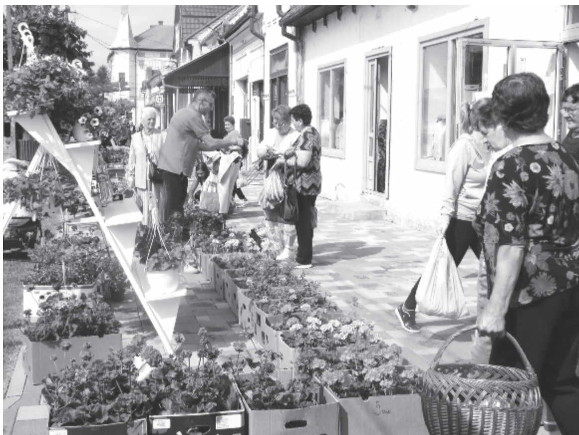
Bő volt a kínálat, nagy volt az érdeklődés is