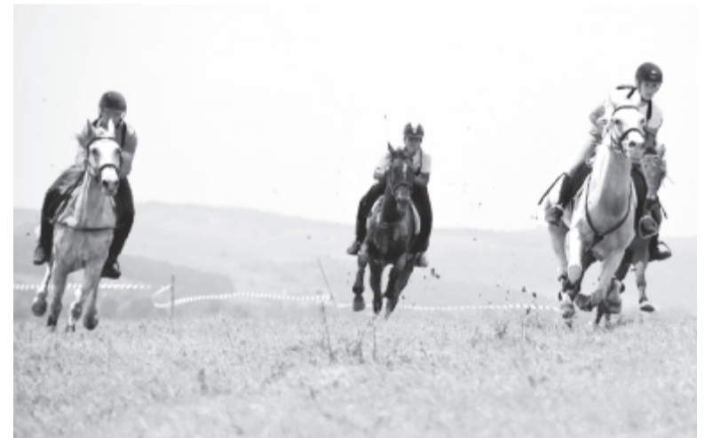
Idén is izgalmas futamokat és érdekes lovas programokat láthatnak a kilátogatók