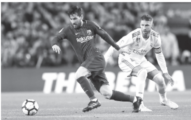
Lionel Messi (b) és Sergio Ramos egyéni csatája

Gyors gólváltással indult az El Clásico: Luis Suárez révén a katalánok szereztek vezetést a 10. percben, a fővárosiak négy perccel később Cristiano Ronaldo találatával egyenlítették. A folytatásban a madridiak játszottak aktívabban, a féldő közepén a portugál aranylabdás előtt két lehetőség is adódott. A házigazdák kényelmesen szőtték akcióikat, így csak egyszer kerültek helyzetbe. A szünet előtti percekben az addig sportszerű mérkőzésen az indulatoké lett a főszerep. Több akciónál is párok akaszkoztak össze, az egyik végén Sergi Roberto odacsapott Marcelónak, így a Barcelona hátvédjét kiállította a játékvezető. Luis Suárez erőszakos-